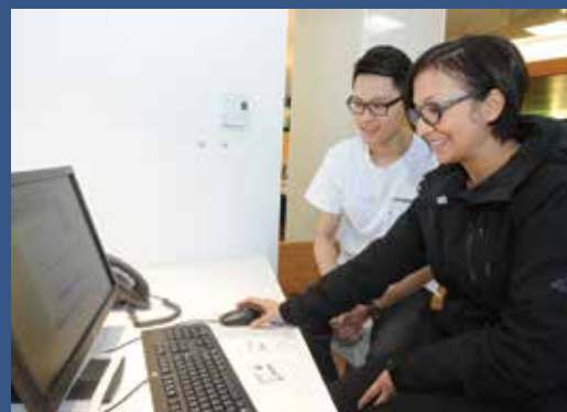
Accompagnement lors de périodes d'inscription