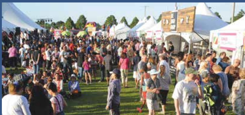
Festin culturel de Brossard