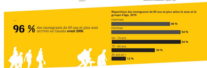
Table de concertation des aînés de l'île de Montréal

... sont nés ailleurs qu'au Canada (44 %). Cette proportion est plus élevée que dans l'ensemble de la population montréalaise (34 %).